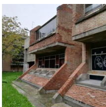
scuola Pietro Lana