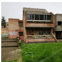
scuola Pietro Lana