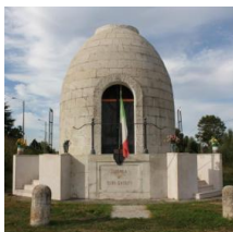
monumento ai caduti a Codrea